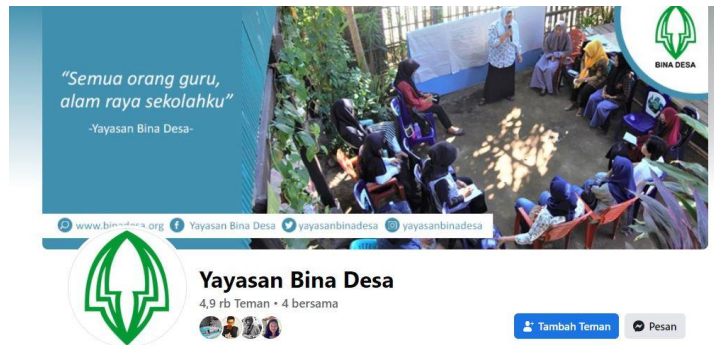
Gambar 4 Salah satu laman yang dihadirkan pada materi yang menjadi contoh penggunaan media sosial bagi desa

media sosial yang potensial digunakan untuk menyebarkan informasi kepada warga desa sekaligus juga tata cara pemanfaatannya dan fitur yang wajib diketahui oleh peserta. Baik materi pertama dan kedua berlangsung selama dua hari.