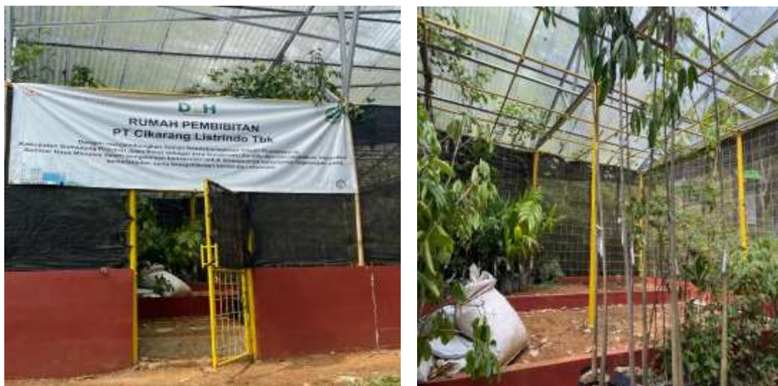
Gambar 2. Pohon tanaman endemik

Program ini bertujuan untuk meningkatkan kualitas lingkungan dengan menanam 300 pohon yang terdiri dari tanaman endemik diantaranya pohon saninten, gandaria, hantap, kacapi, teureup dan pohon endemik lainnya. Kegiatan ini diharapkan mampu menjaga keseimbangan ekosistem serta meningkatkan ketahanan tanah dan mengurangi dampak dari perubahan iklim.