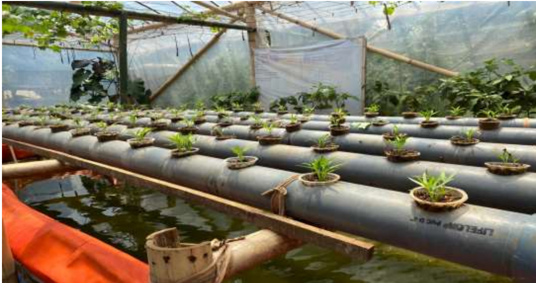
Gambar 3. Tanaman Aquaponik

Kegiatan ini bertujuan untuk meningkatkan ketahanan pangan dan kesejahteraan ekonomi masyarakat, khususnya bagi kelompok perempuan Desa Sindangsari. Akuaponik menggabungkan sistem budidaya ikan dan tanaman dalam satu ekosistem yang berkelanjutan sehingga mampu menghasilkan panen yang lebih efisien dan ramah lingkungan. Berikut merupakan hasil dokumentasi kegiatan Aquaponik oleh kelompok Srikandi Desa Sindangsari.