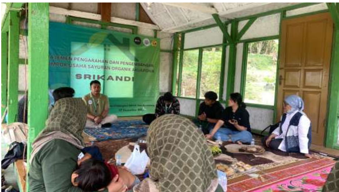
Gambar 4. Pertemuan kelompok Srikandi

Kelompok Srikandi rutin mengadakan pertemuan untuk mendiskusikan perkembangan usaha, berbagi pengetahuan mengenai teknik aquaponik serta melakukan evaluasi untuk hasil yang telah disepakati sebelumnya, hal ini guna untuk meningkatkan produktivitas dan kesejahteraan anggota kelompok.