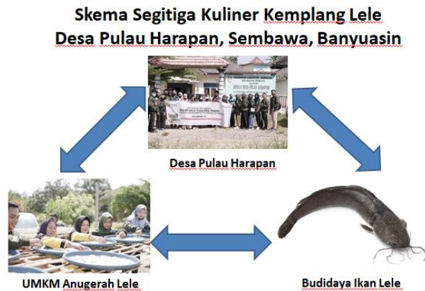
Gambar 4. Segitiga Kuliner Kemplee

Tiga kolam terpal yang dimiliki UMKM Anugerah Lele dalam 1 tahun mereka dapat melakukan panen 4-5kali atau dengan lama budidaya lele yakni 2,5 s/d 3 bulan yang kemudian dapat langsung dijual atau diolah menjadi beberapa panganan. Selain kemplang lele, pengembangan produk selanjutnya adalah stik lele, nugget lele, pempek lele dan kemplang tulang dan kulit lele sehingga tidak menghasilkan limbah dari budidaya ikan lele yang mereka lakukan.