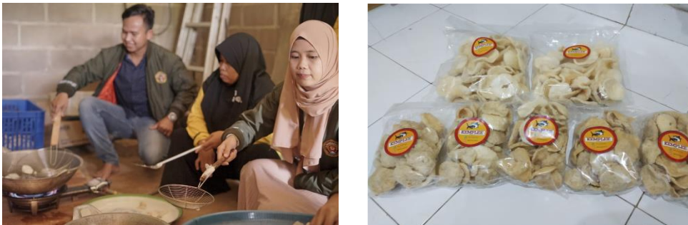
Gambar 5. Proses Penggorengan dan Pengemasan

Tiga kolam terpal yang dimiliki UMKM Anugerah Lele dalam 1 tahun mereka dapat melakukan panen 4-5kali atau dengan lama budidaya lele yakni 2,5 s/d 3 bulan yang kemudian dapat langsung dijual atau diolah menjadi beberapa panganan. Selain kemplang lele, pengembangan produk selanjutnya adalah stik lele, nugget lele, pempek lele dan kemplang tulang dan kulit lele sehingga tidak menghasilkan limbah dari budidaya ikan lele yang mereka lakukan.