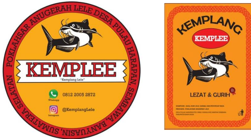
Gambar 7. Sticker dan Label persegi KEMPLEE Poklashsar Anugerah Lele

dibuat menunjukkan gambar ikan lele sebagai bahan utama pembuatan kemplang, sertawarna kuning untuk menunjukkankehangatan kuliner serta informasi akan identitas dari UMKM Anugerah Lele sendiri yang menyebut diri sebagai Poklashsar (Kelompok Pengolahan Pemasaran) Anugerah Lele Desa PulauHarapan Sembawa Banyuasin SumatraSelatan dengan No WA 0812 2005 2872dan akun IG @kemplanglele.