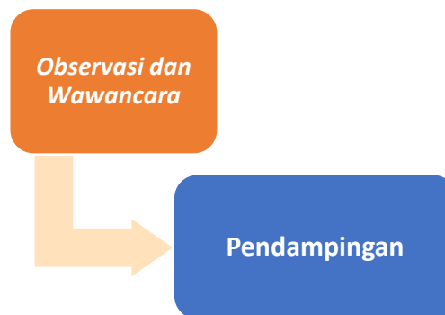
Gambar 3. Metode Pelaksanaan Pengabdian kepada Masyarakat