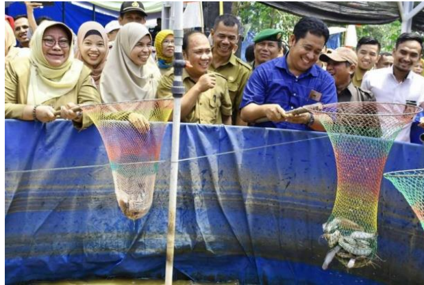
Gambar 1. Bupati Banyuasin H. Askolani Dorong Program Petani Bangkit Sektor Perikanan

wawancara, bahwa awalnya mereka mendapatkan bantuan dari pihak Pemerintah Kabupaten Banyuasin pada tahun 2019(Kabupaten Banyuasin, 2020). Adapun bukti kegiatan ini dapat dilihat pada gambar 1.