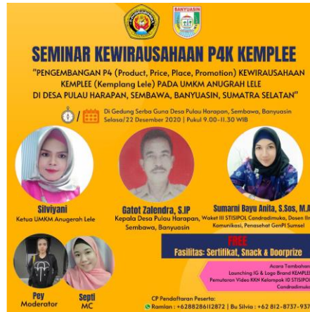
Gambar 9. Kegiatan Seminar Kewirausahaan P4K KEMPLEE

Pelaksanaan Seminar Kewirausahaan P4K KEMPLEE: Pengembangan P4 ( Product, Price, Place, Promotion ) Kewirausahaan Kemplang Lele pada UMKM Anugerah Lele di Desa Pulau Harapan, Sembawa, Kabupaten Banyuasin, Sumatera Selatan bertempat di Gedung Serba Guna Desa Pulau Harapan, Sembawa, Banyuasin pada hari Rabu, 22 Desember 2020 pukul 9.00-11.30 WIB menjadi puncak kegiatan pengabdian masyarakat yang dilakukan dalam rangka Pengabdian kepada Masyarakat Candradimuka Tahun 2020.