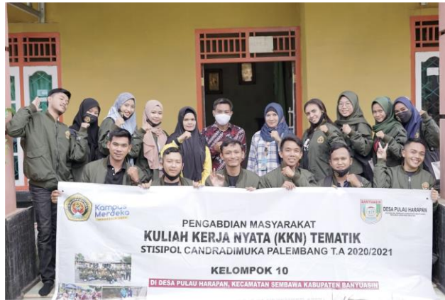
Gambar 6. Bersama Mitra (UMKM Anugerah Lele)