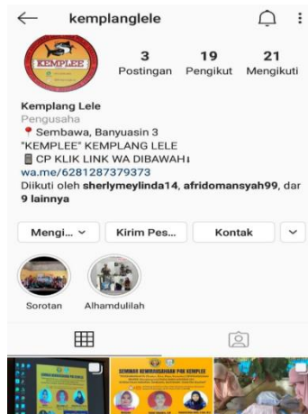
Gambar 8. Media Sosial Kemplang Lele

Pembuatan akun media sosial khusus dibuat untuk membantu agar Kemplang Lele lebih dikenal oleh khalayak. Pembuatan akun media sosial Instagram @kemplanglele ini dibuat oleh mahasiswa STISIPOL Candradimuka atas nama Rio Setiawan dan dikelola sebagai admin oleh Ramlan. Kemudian diserahkan email dan password kepada pihak UMKM Anugerah Lele berbarengan dengan pelaksanaan seminar kewirausahaan. Pemilihan Instagram ketimbang media sosial yang lain karena secara persentase saat ini generasi millennial lebih banyak menggunakan Instagram.