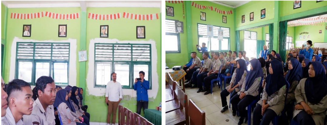
Gambar 3. Seminar Membangun Personal Branding di Era Digital

website atau aplikasi seperti Kalibrr, Jobstreet, Linkedid dan aplikasi lainnya serta bagaimana membuat CV yang menarik melalui aplikasi Canva.