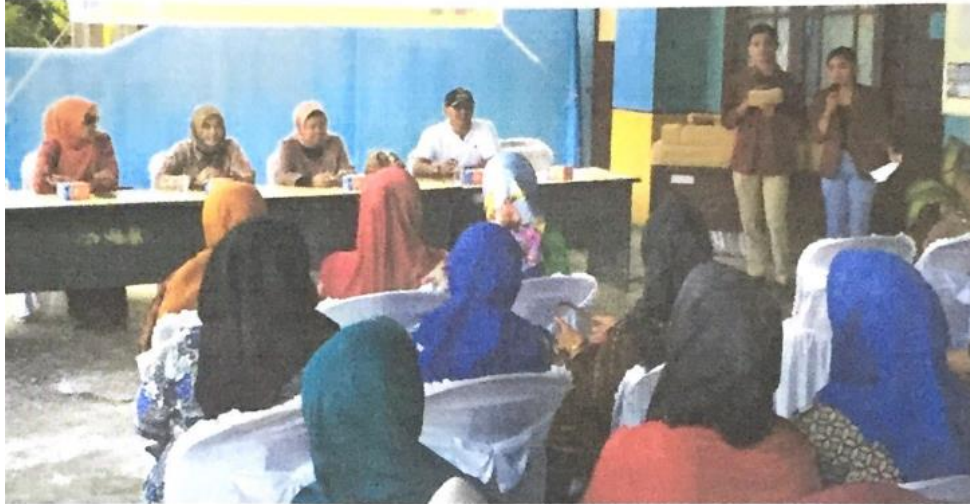
Gambar 2. Kegiatan Sosialisasi Pola Hidup Bersih dan Sehat (PHBS)

Mengadakan sesi edukasi mengenai pentingnya PHBS di lingkungan masyarakat, terutama kepada ibu rumah tangga dan kader kesehatan di RT 04 RW 06. Materi edukasi mencakup pengelolaan sampah yang benar, mencuci tangan dengan sabun dan air bersih, memberantas jentik nyamuk di lingkungan rumah. Adapun manfaat dari kegiatan ini adalah agar masyarakat mampu menciptakan lingkungan yang sehat dan mencegah terjadinya penyebaran penyakit. Di bawah ini adalah hasil dokumentasi kegiatan sosialisasi ri RT 04 RW 06, Kelurahan Bukit Baru.