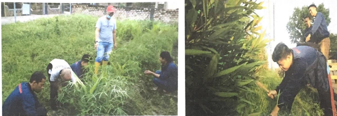
Gambar 3. Kegiatan membersihkan lingkungan RT 04 RW 06

Kegiatan ini dapat dilakukan melalui gorong royong kebersihan lingkungan bersama dengan masyarakat untuk membersihkan lingkungan sekitar, seperti membersihkan area publik, membersihkan lingkungan rumah dan membersihkan saluran air. Melalui aksi sosial seperti ini dapat mendorong masyarakat untuk berkontribusi dalam menciptakan lingkungan yang sehat, indah dan bersih bagi semua, dan hasilnya dapat mewujudkan lingkungan nyaman bagi anak-anak. Berikut di bawah ini merupakan dokumentasi kegiatan aksi sosial di RT 04 RW 06, Kelurahan Bukit baru.