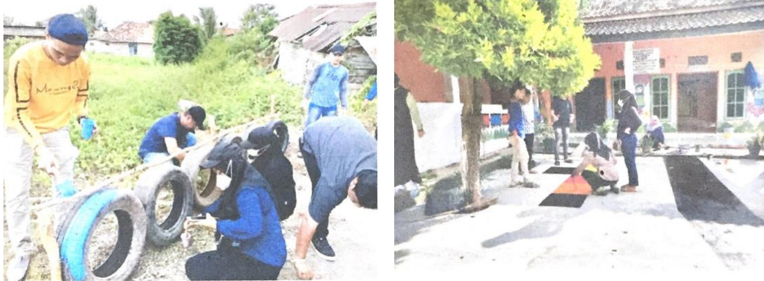
Gambar 4. Kegiatan gotong royong mewujudkan lingkungan sehat, indah dan bersih

kelompok 2 membersihkan lingkungan masjid, kelompok 3 membersihkan TK yang ada di RT 04, kelompok 4 membersihkan lingkungan disekitar panti asuhan, dan kelompok 5 membersihkan saluran air. Selanjutnya kelompok mahasiswa menyiapkan perlengkapan untuk digunakan menghias jalanan dan ruang publik di RT 04. Di bawah ini adalah hasil dokumentasi kegiatan pengabdian masyarakat melalui kegiatan aksi sosial mewujudkan lingkungan yang sehat, indah dan bersih.