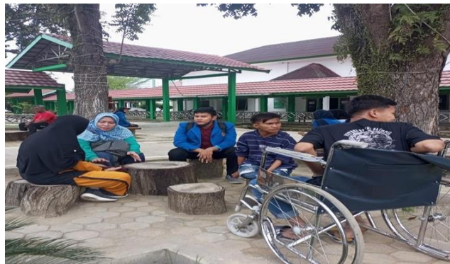
Gambar 3. Pendekatan terhadap anak penyandang disabilitas dan orangtua Sumber: diolah oleh Penulis, 2023

Sesuai dengan wawancara yang dilakukan tim pengabdian dan mahasiswa terhadap anak penyandang disabilitas serta observasi, beberapa anak sering merasa tidak percaya diri dan juga dia ingin berpendidikan seperti orang lain. Intervensi terhadap anak penyandang disabilitas dilakukan oleh tim pengabdian dibantu pengurus panti dan rekan-rekan mahasiswa. Fokus pada intervensi terhadap individu yang bermasalah, keluarga dan peer group anak. Hal tersebut dimaksudkan agar intervensi tim pengabdian dibantu pengurus sentra dan rekan mahasiswa dapat mengatasi permasalahan yang ada, baik itu pada diri anak. Kegiatan ini akan dibawa ke tahap selanjutnya yaitu Focus Group Discussion yang dilaksanakan selama 2 hari berturut-turut. Hal ini dapat dilihat pada gambar 3 dan gambar 4.