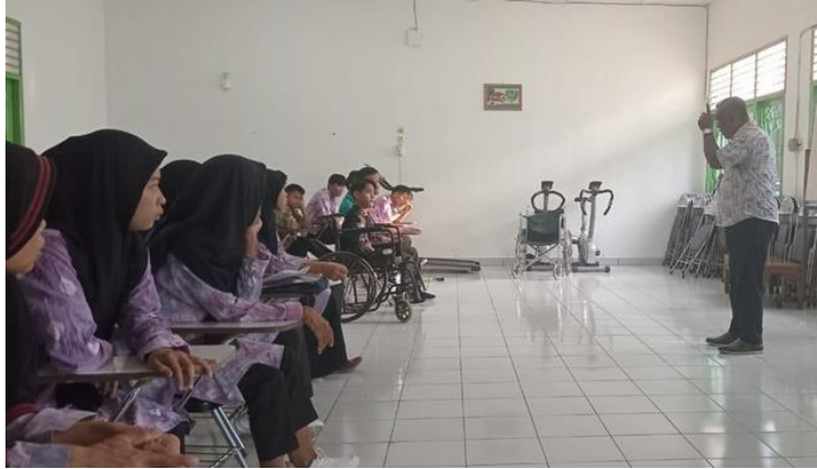
Gambar 4. Pelaksanaan Pengabdian kepada Masyarakat

Pada gambar 4, terlihat tim pengabdian mengawali dengan sambutan yang ramah, santai, dan humoris seperti sapaan terhadap keluarga, teman dan sahabat. Menyampaikan maksud dan tujuan edukasi, memberi ruang kepada anak sentra agar bersifat terbuka dalam segala masalah yang dihadapi. Tim pengabdian mengajak klien untuk sharing dan bercerita tentang aktivitas sehari-hari klien sampai pada persoalan pribadi. Tim pengabdian membagi menjadi berbagai kelompok dan mencoba mengobservasi dan mengeksplorasi kondisi anak pada saat anak mengungkapkan permasalahan atau tekanan yang dihadapinya. Nampak dari ekspresi wajahnya saat tim pengabdian bertanya mengenai pendidikan dan kehidupannya. Penjalinan relasi juga mulai dilaksanakan, sebagai langkah awal penjalinan relasi dibantu pekerja sosial sekaligus pembimbing di Sentra Budi Perkasa Palembang". Small talk , teknik ini digunakan untuk menjalin keakraban antara anak penyandang disabilitas dengan tim pengabdian. Hal ini dilakukan dari mulai awal bertemu sebagai kontak awal pada jam 09.00 wib samapi dengan selesai. Tujuannya untuk mengawali kontak agar tidak terjadi kekakuan dan dengan harapan akan terciptanya hubungan yang akrab.