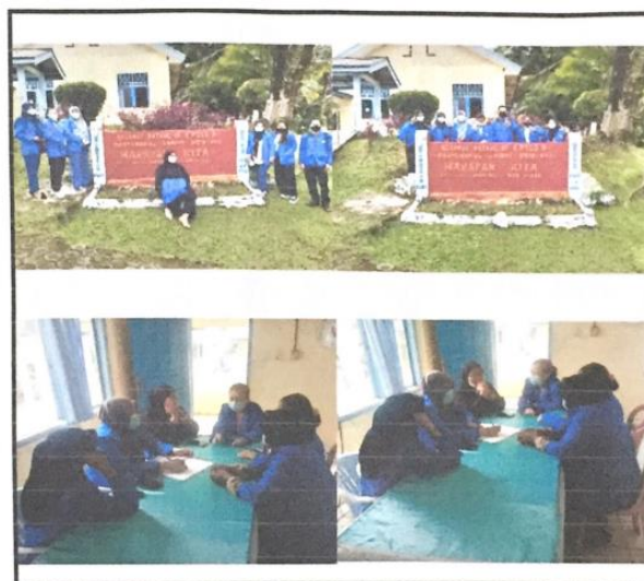
Gambar 1. Rapat penyusunan agenda praktik kerja lapangan

Pada tahapan ini mahasiswa kelompok praktikum melakukan observasi sebelum menentukan program yang sesuai dengan kondisi lansia di panti sosial. selanjutnya, kelompok praktikum mengadakan rapat penyusunan program PPKS (Praktikum Pelayanan Kesejahteraan Sosial) termasuk didalamnya membahas anggaran dana yang dibutuhkan selama kegiatan berlangsung seperti pembelian bibit ikan lele, bibit sayuran, dan bahan mentah untuk pembuatan produksi coklat. Di bawah ini dokumentasi mahasiswa pertama kali datang ke lokasi kegiatan pengabdian dan rapat penyusunan agenda praktik kerja lapangan.