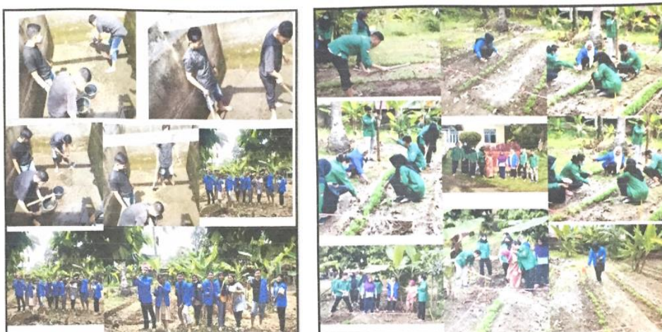
Gambar 2. Pembersihan lahan dan kolam ikan lele

Berikut adalah dokumentasi kegiatan budidaya tanaman sayur dan budidaya ikan lele yang dilakukan oleh mahasiswa STISIPOL Candradimuka bersama dengan perwakilan lansia usia produktif dan petugas Panti Sosial Harapan Kita.