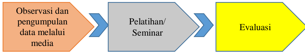
Gambar 2. Metode Pelaksanaan Pengabdian kepada Masyarakat