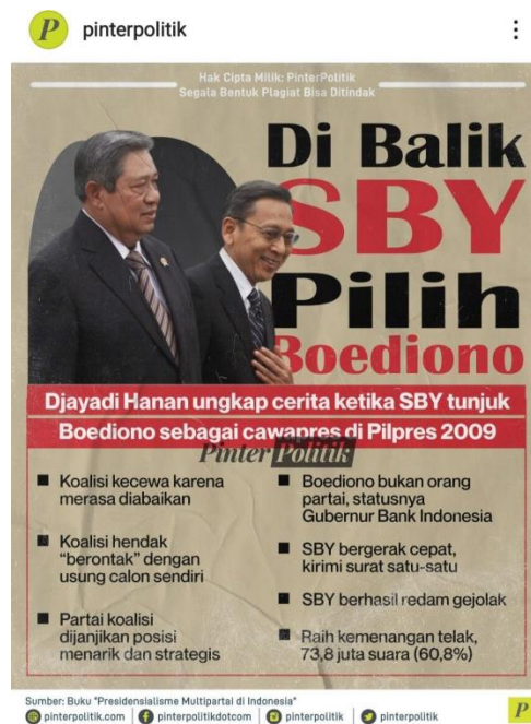
Gambar 3. Capture Instagram Tokoh Politik

Etika akan di analisis mulai dari perspektif komunikator, pesan, saluran dan komunikan, efek, umpan balik berikut gangguan ( noise ) dari proses komunikasi yang dapat mendeskripsikan mengenai etika dalam berkomunikasi di ranah politik. Dalam pemahaman ini penulis juga menggunakan model untuk lebih memahami, komunikasi sebagai aksi, Interaksi, dan Transaksi dalam proses komunikasi politik. Teoritikus komunikasi menciptakan model-model ( models ), atau representasi sederhana dari hubungan-hubungan kompleks di antara elemen-elemen dalam proses komunikasi, yang mempermudah kita untuk memahami proses yang rumit. Di sini akan dibahas tiga yang paling utama: Model Komunikasi Sebagai Aksi: Model Linear;. Dalam komunikasi politik seperti memasang poster, banner, atau menyebarkan brosur yang tujuannya memperkenalkan kandidat atau simbol-simbol partai. Saluran visual tersebut akan ditangkap oleh masyarakat yang akhirnya menjadi saluran tactile ( persepsi secara nyata ) sebagai informasi.