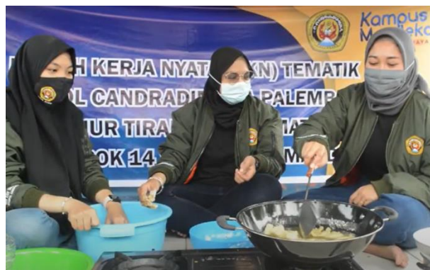
Gambar 6. Pembuatan Kripik Jamur Tiram