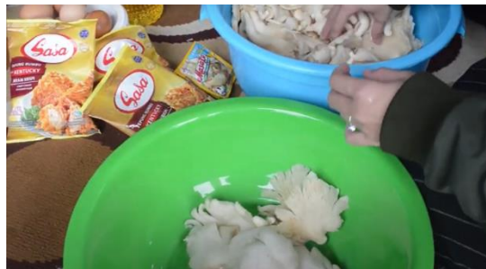
Gambar 5. Pemanfaatan Jamur Tiram