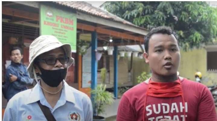
Gambar 1. Observasi dan diskusi awal bersama masyarakat

Adapun observasi di awal melihat kondisi tempat yang ingin dijadikan pengabdian kepada masyarakat, lokasi harus punya sebuah tempat sendiri untuk tempat budidaya jamur. Adapun gambar observasi dan diskusi awal dapat dilihat pada Gambar 1.