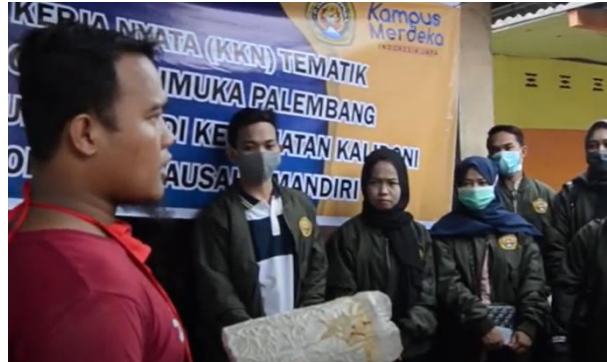
Gambar 4. Pelatihan Budidaya Jamur