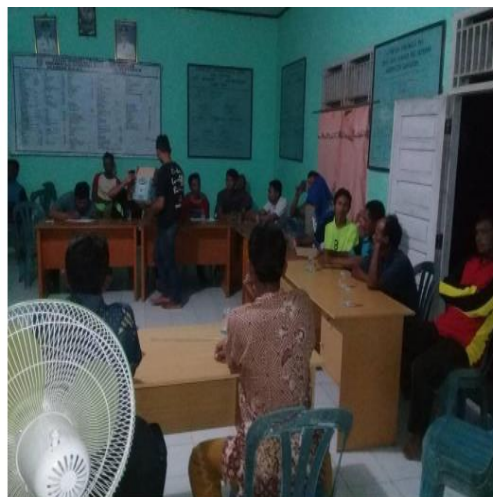
Gambar 2. In House Training Pengelolaan Dana BUMDES Desa Lubuk Sakti

Adapun hasil dari kegiatan ini bertujuan untuk memberikan In House Training kepada pengelola BUMDES Desa Lubuk Sakti agar dapat menyelesaikan permasalahan mitra dengan melalui pelatihan dan pendampingan kepada pengurus. Hasil pengabdian kepada masyarakat menunjukkan ada beberapa faktor yang menyebabkan BUMDES Desa Lubuk Sakti tidak berjalan secara optimal, yaitu: sumber daya manusia yang masih lemah, kurangnya koordinasi internal, kurangnya biaya operasional terhadap sarana dan prasarana dan minimnya penguasaan teknologi.