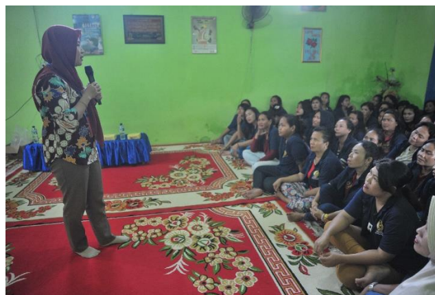
Gambar 3. Proses Pelatihan dan transfer ilmu

Tahapan pendampingan para peserta akan diminta mempraktekkan semua materi yang diterima, sekaligus mempresentasikan di tengah masyarakat. Dalam tahapan ini pemateri akan berperan sebagai tutor sekaligus penilai serapan materi dan efektivitas strategi.