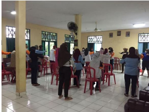
Gambar 2. Pelatihan di Panti Sosial