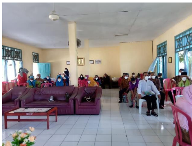
Gambar 1. Panti Sosial

Berdasarkan hasil observasi, diketahui bahwa peran Panti Sosial dalam pelatihan keterampilan berkomunikasi di Panti Sosial Rehabilitasi Wanita Tuna Sosial di Indralaya Kabupaten Ogan Ilir masih belum maksimal. Hal ini dikarenakan kurangnya jumlah petugas serta kurangnya penyediaan sarana dan prasarana yang masih sangat minim. Berdasarkan permasalahan mengenai pemberdayaan perempuan, maka penulis tertarik menganalisis tentang Pelatihan Keterampilan Berkomunikasi di Panti Sosial Rehabilitasi Wanita Tuna Sosial, Indralaya, Kabupaten Ogan Ilir.