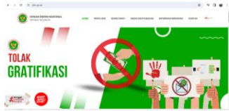
Gambar 6. Website DEN

keterbatasan anggaran. Namun keterbatasan tidak menjadikan alasan, perlu alternatif lainnya untuk meningkatkan sinergitas, kolaborasi serta sinkronisasi dalam hal penguatan kelembagaan DEN.”