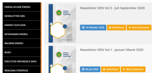
Gambar 2. Media Publikasi