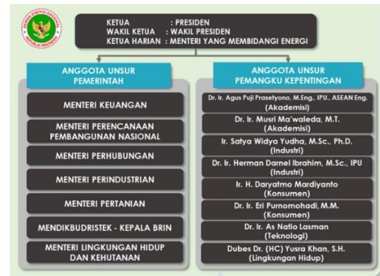
Gambar 1. Struktur DEN

Kabinet saat ini terdiri dari menteri-menteri yang bertanggung jawab di bidang keuangan, perindustrian, perhubungan, pertanian, badan perencanaan pembangunan nasional (Bappenas), riset teknologi, kehutanan dan lingkungan hidup, serta delapan anggota yang ditunjuk oleh unsur pemangku kepentingan.